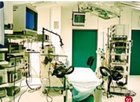
91 Het operatiekwartier van het CRG.

als ze niet uitgevoerd zijn, mag u niet onder algemene verdoving gebracht worden en kan de ingreep niet doorgaan.